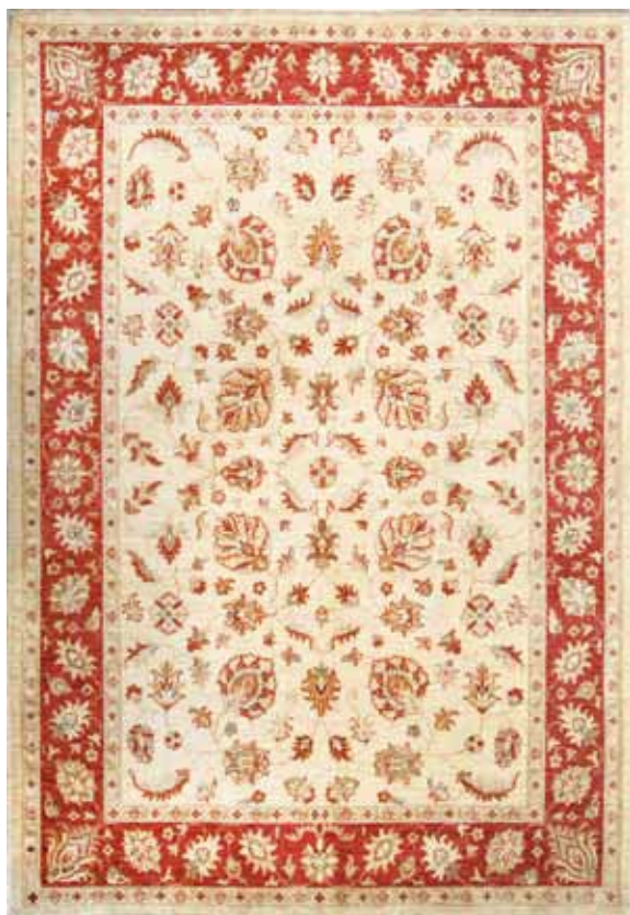
PAK-ZIGLER ISLAMABAD SP/09900 172x227