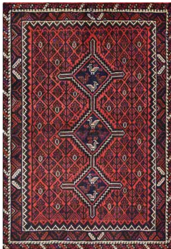
IR-GASHGAY 250297 140x176