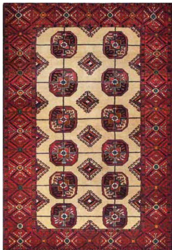
IR-KHORASSAN 250352 109x192