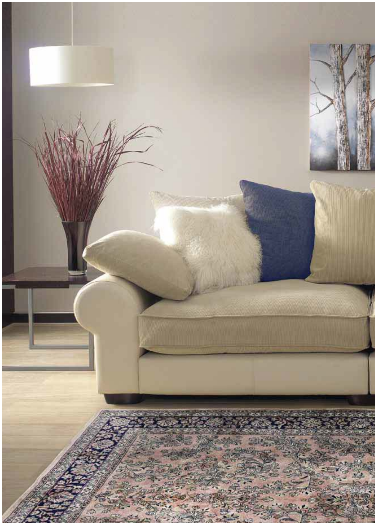
INDO SAROUGH SP/09089 100% lã. Produção manual.