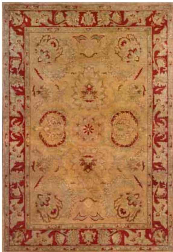
INDO JAIPUR MAS025/009 140x200 / 170x240 / 200x300