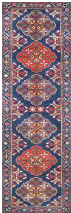
RU-MIKRAH 233271 085x309