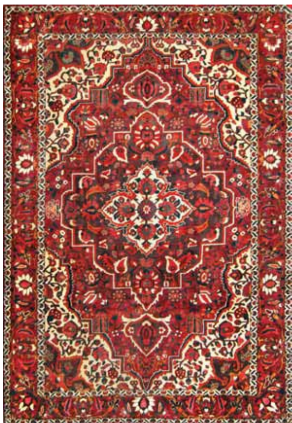
IR-BACTIAR 250411 212x300