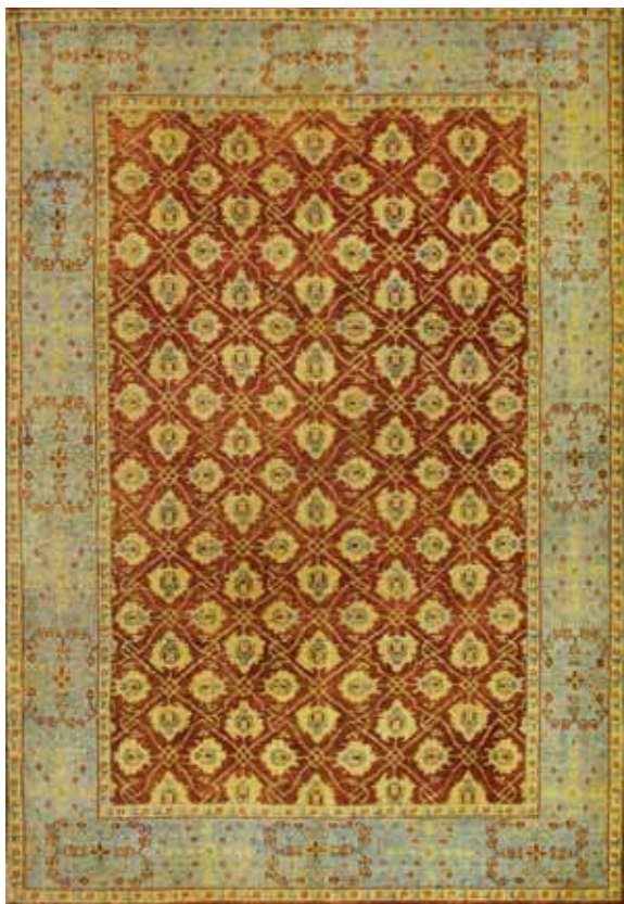
MAMLUK ML01A/192 140x200 / 170x240 / 200x300