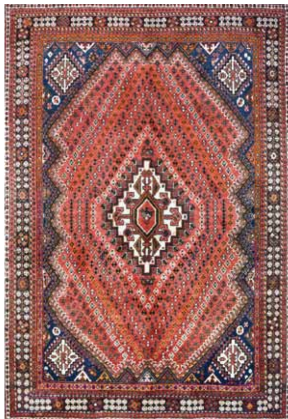
IR-GASHGAY 250320 204x300