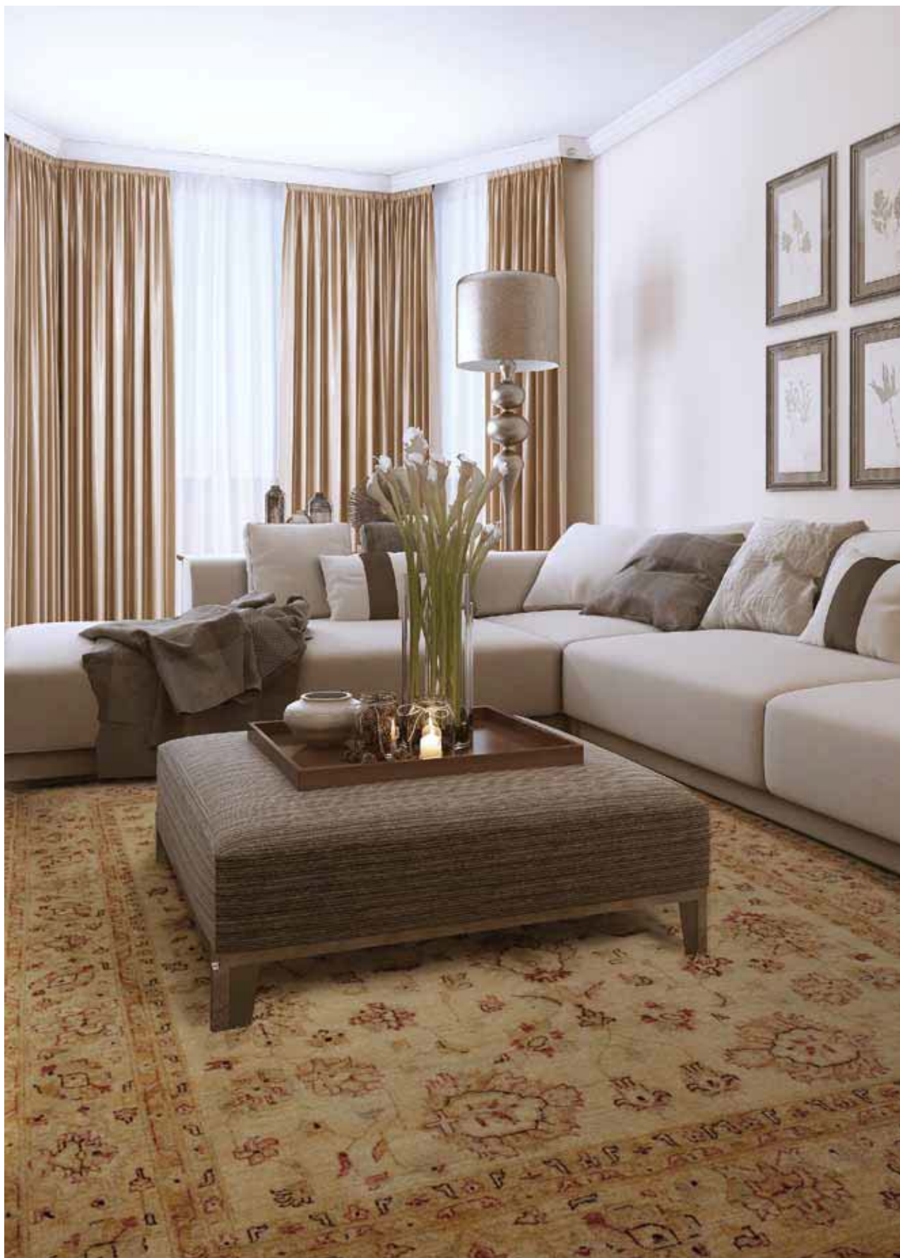
PAK-ZIGLER ISLAMABAD SP/09896 100% lã. Produção manual.