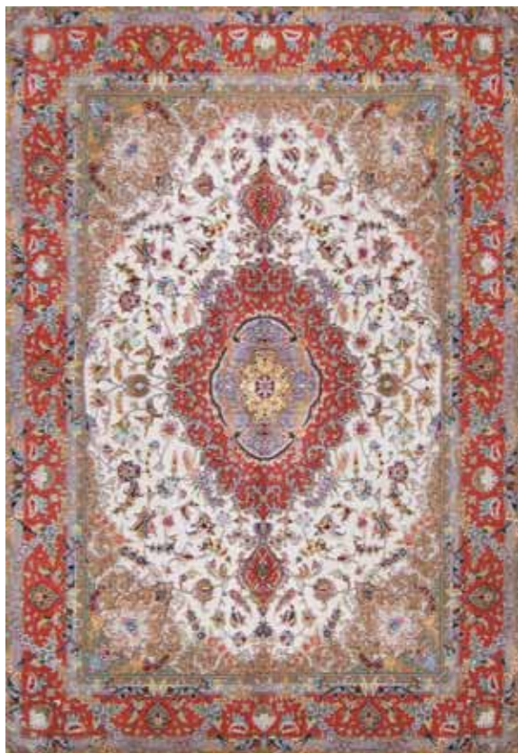
IR-TABRIZ JAVAN SP/09377 154x204