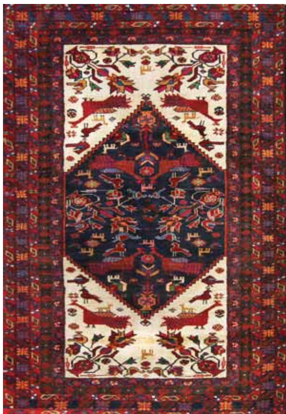
IR-KHORASSAN 250657 103x200