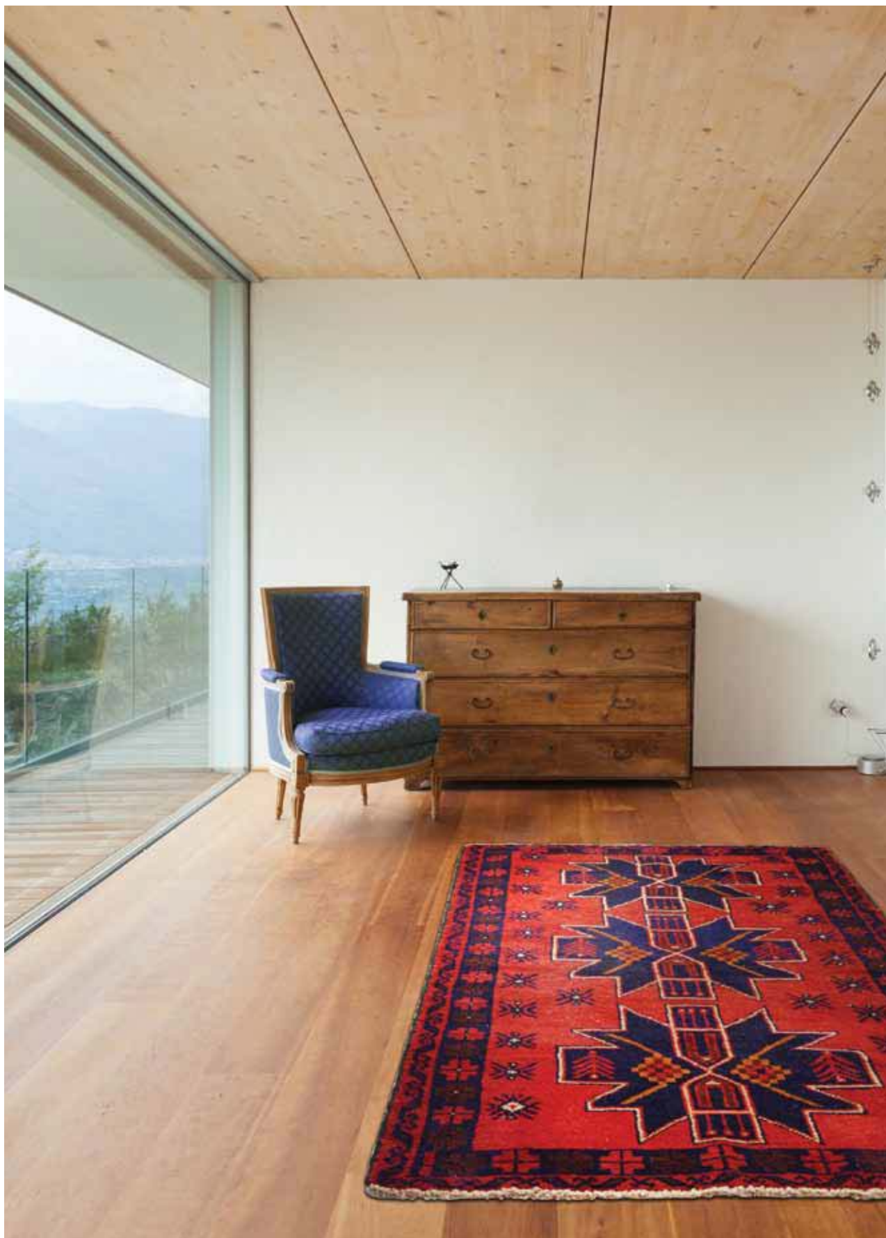
AF-ADRESKANI 251454 100% Lã. Produção manual