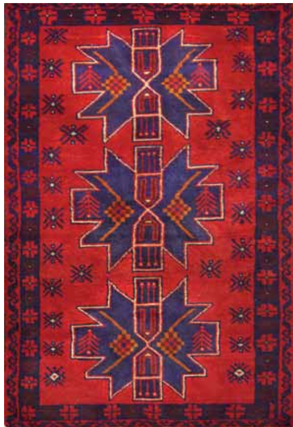
AF-ADRESKANI 251454 100x200