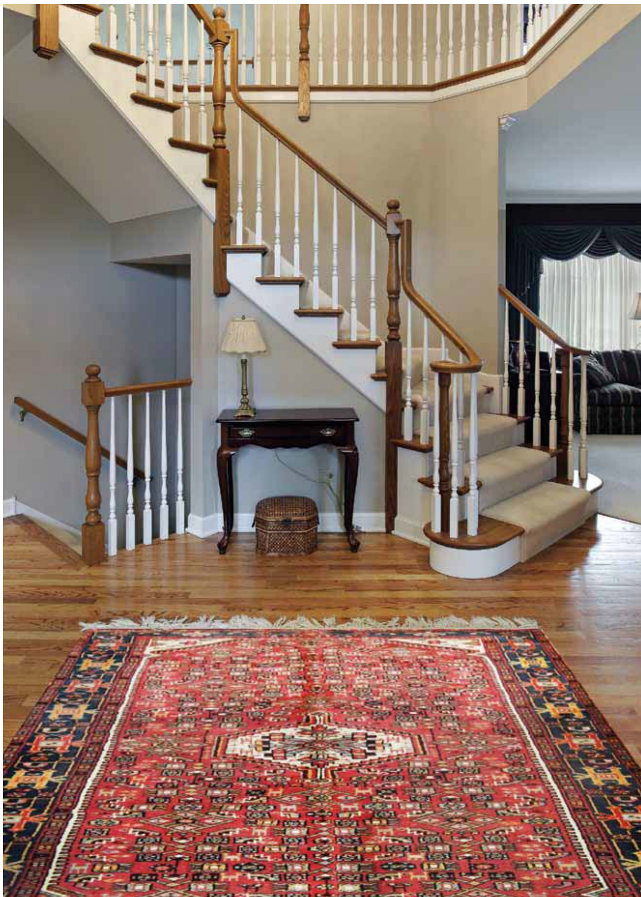
IR HAMADAN 250527 100% lã. Produção manual.