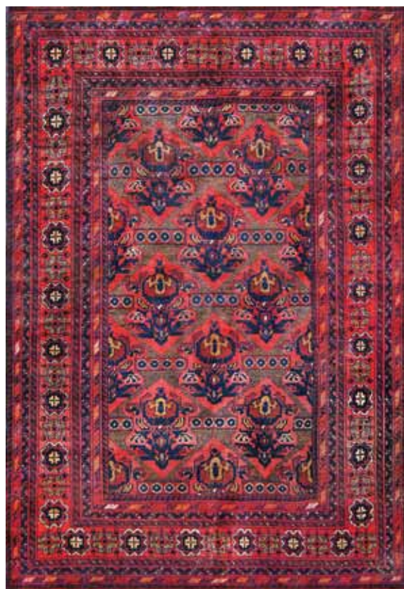
AF-KUNDUZ 244881 144x207