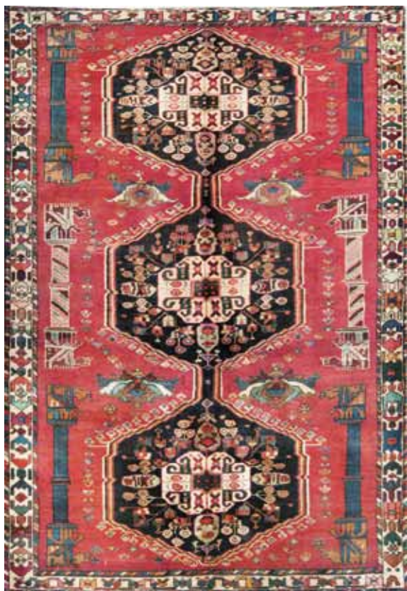
IR-GASHGAY 250316 174x264