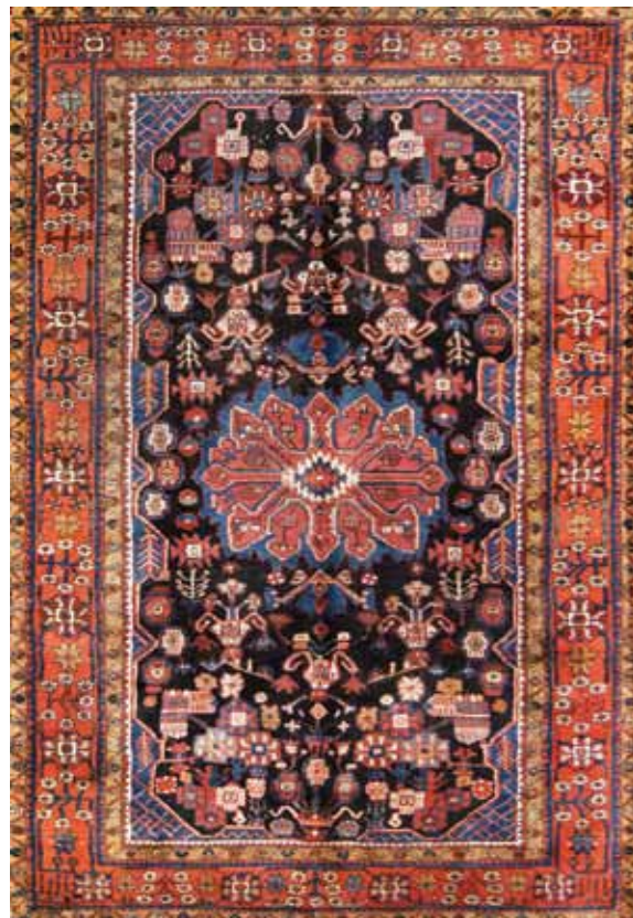
IR-HAMADAN 250524 168x319