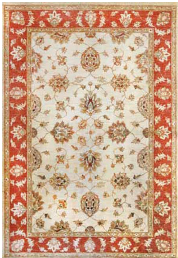
PAK-ZIGLER ISLAMABAD SP/09897 176x240