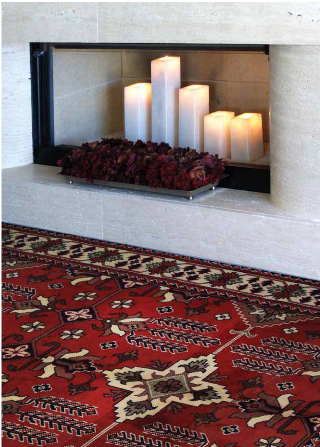
AF-KUNDUZ 249327 100% Lã. Produção manual