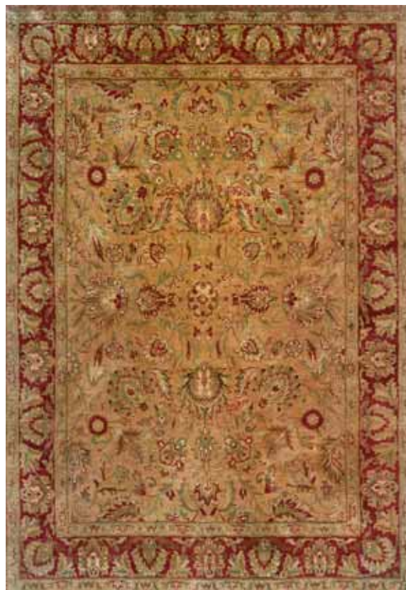
INDO JAIPUR MAS112/009 140x200 / 170x240 / 200x300