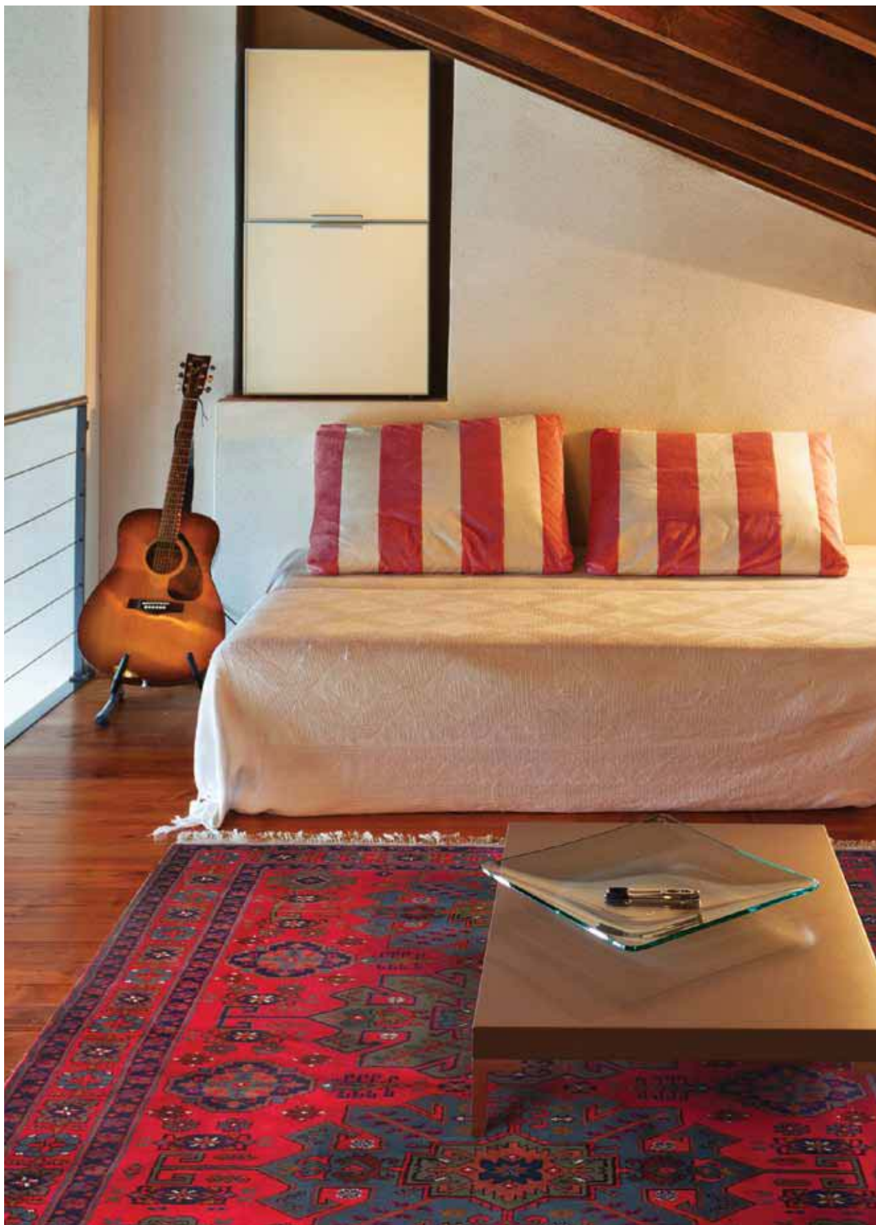
RU-MIKRAH 233282 100% lã. Produção manual.