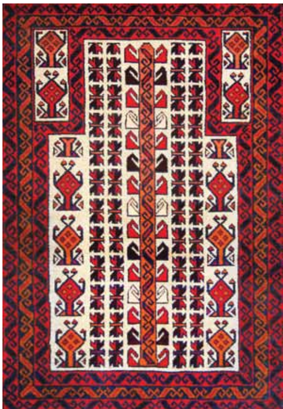
AF-ADRESKANI 248270 080x125