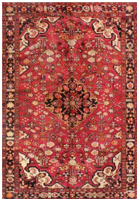
IR-HAMADAN 250538 166x333