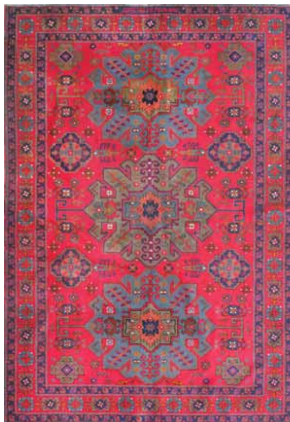
RU-MIKRAH 233282 155x208