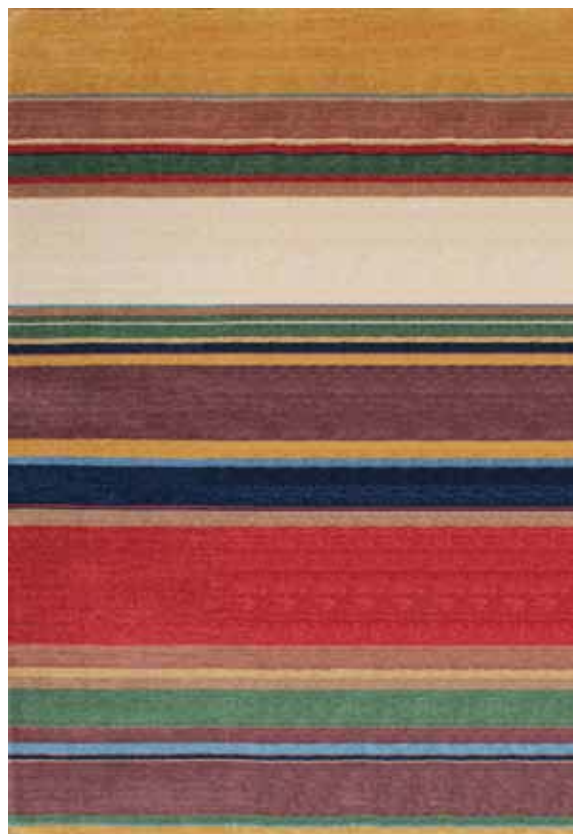
PAK-CHUBI MODERN LD/00360 147x245