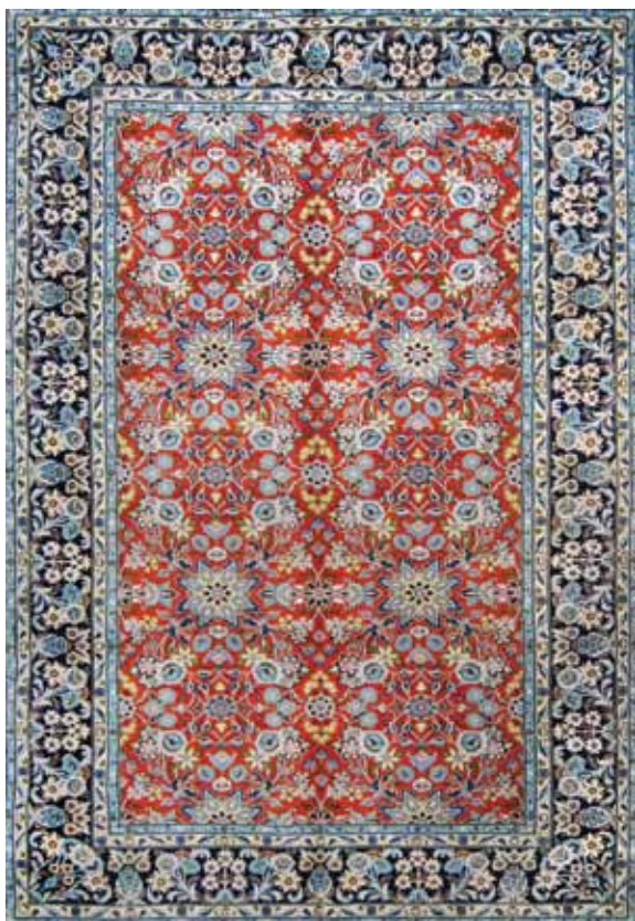
IR-MESCHED SP/02265 197x296