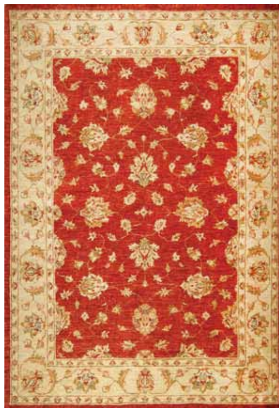
PAK-ZIGLER ISLAMABAD SP/09905 150x199