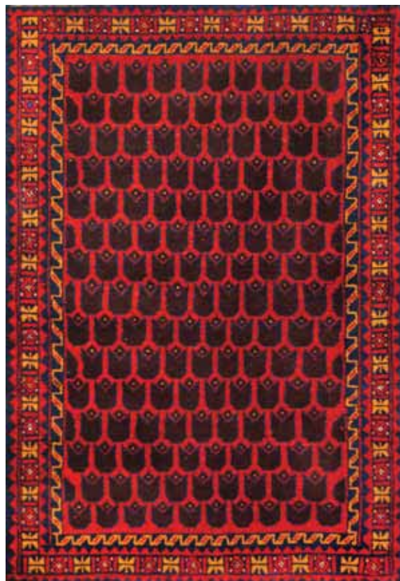
AF-ADRESKANI 249595 080x125