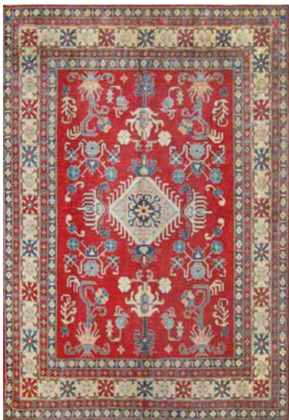
PAK-KAZAK 251154 237x320