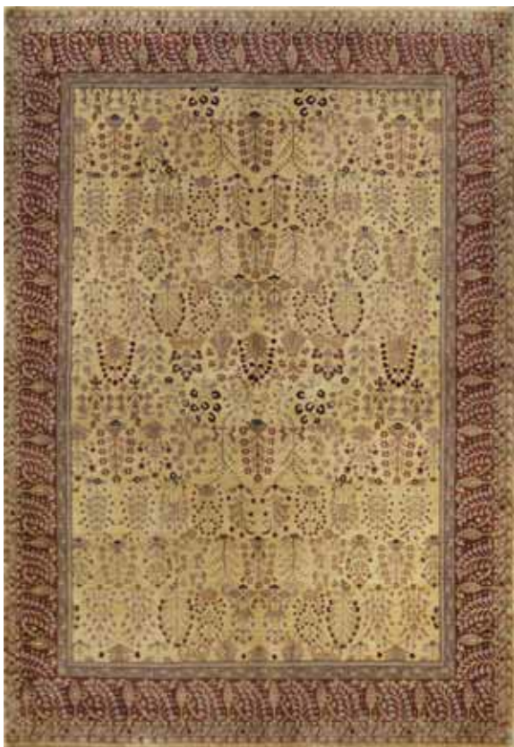
TAJ MAHAL MC1015/115 140x200 / 170x240 / 200x300 / 250x350