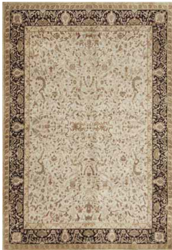
TAJ MAHAL MC1007/002 140x200 / 170x240 / 250x350