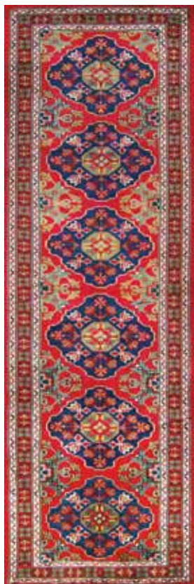
RU-MIKRAH 234082 085x297