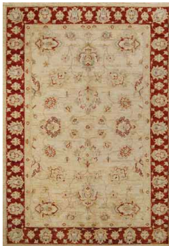
PAK-ZIGLER LAHORE 247435 120x178