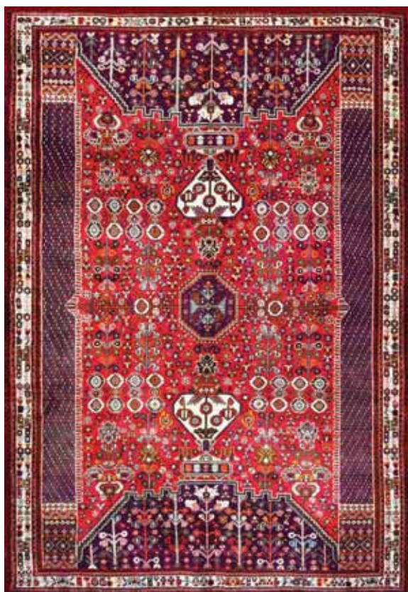
IR-KASHKOLI 250562 180x277