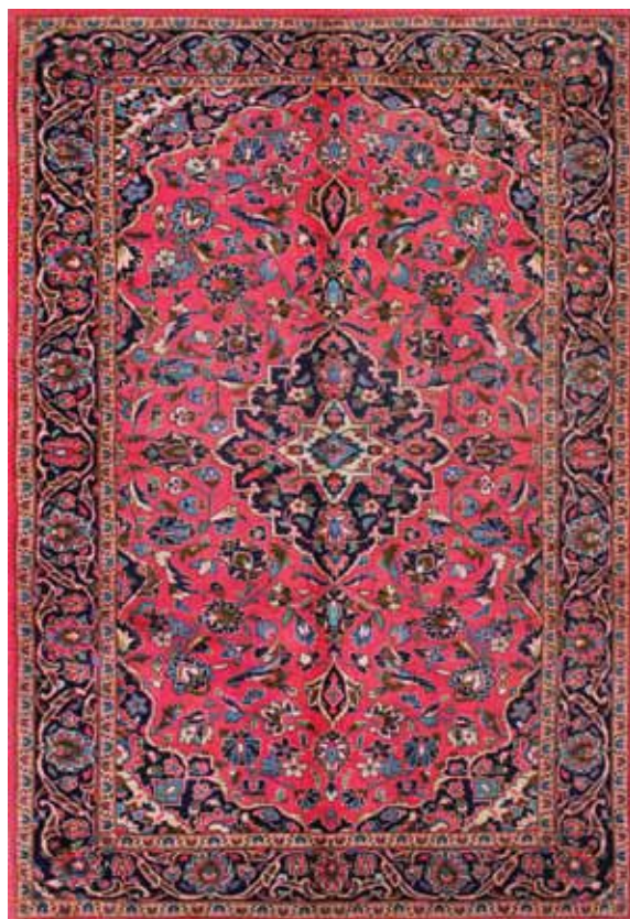
IR-MESCHED 106007 148x255