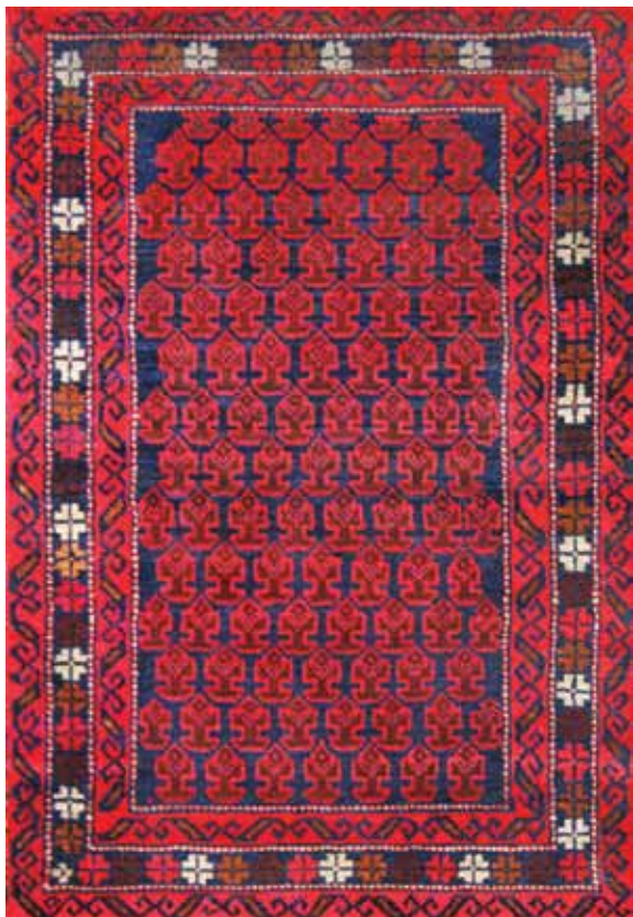
AF-ADRESKANI 251320 080x125