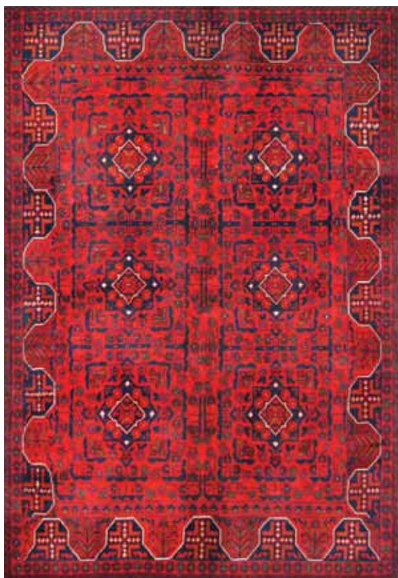
AF-KUNDUZ 246009 148x190