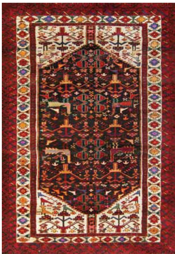
IR-KHORASSAN 250662 105x215