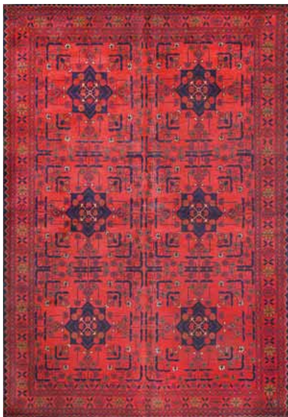
AF-KUNDUZ 244020 146x194