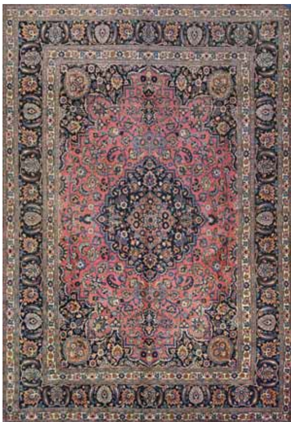
IR-MESCHED 250402 305x392