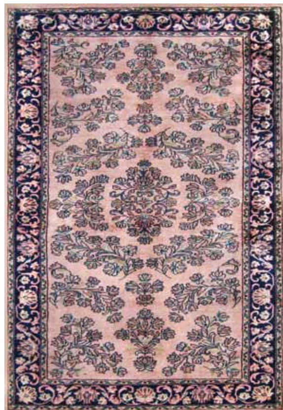
INDO SAROUGH 128345 104x197