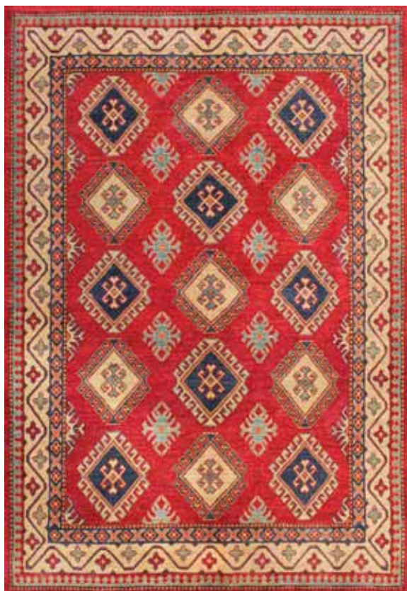
PAK-KAZAK 251089 154x190