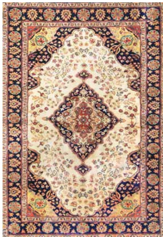
INDO SAROUGH SP/06251 096x148