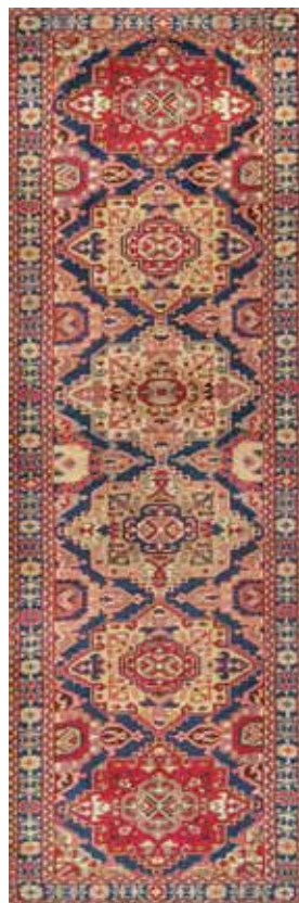
RU-MIKRAH 233222 086x305