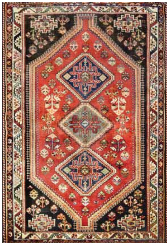
IR-KASHKOLI 250604 107x170