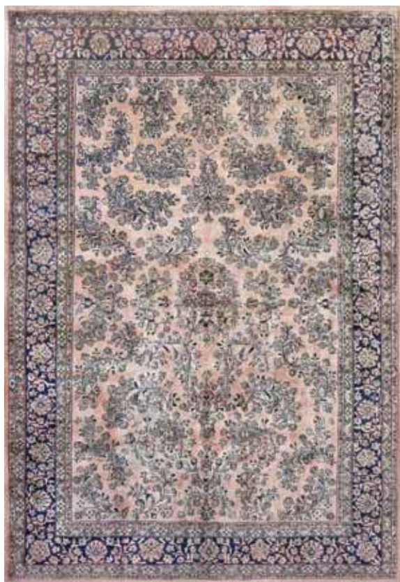
INDO SAROUGH SP/09089 167x234