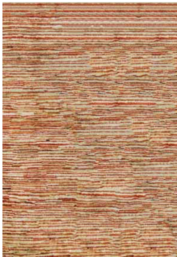
PAK-CHUBI GABEH 239028 091x144