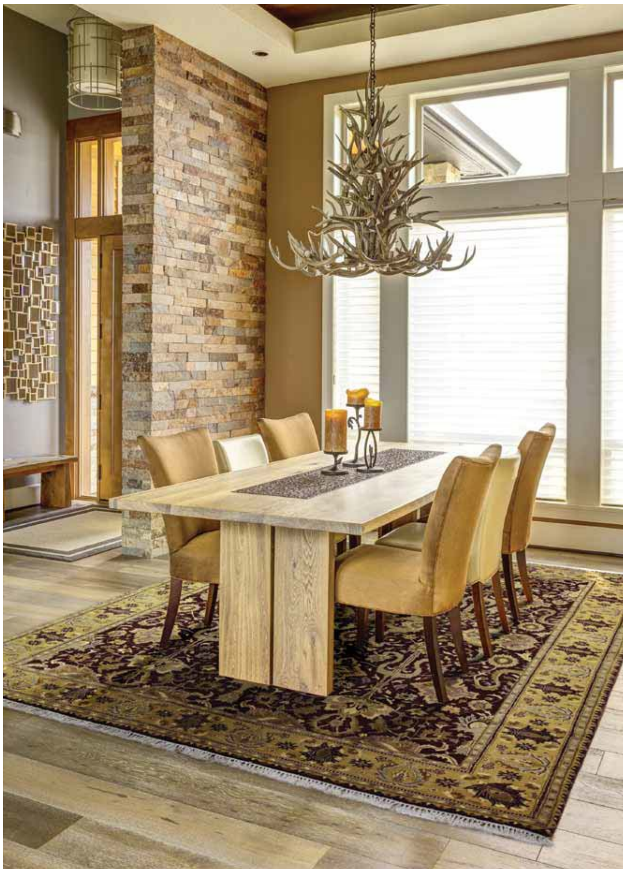
TAJ MAHAL MC1001/006 100% lã. Produção manual.