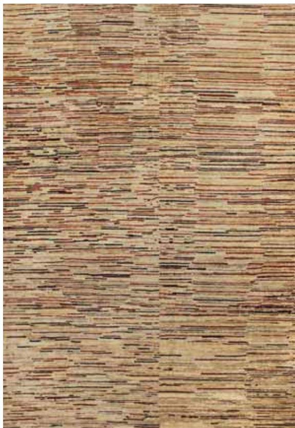
PAK-CHUBI GABEH 246137 198x275