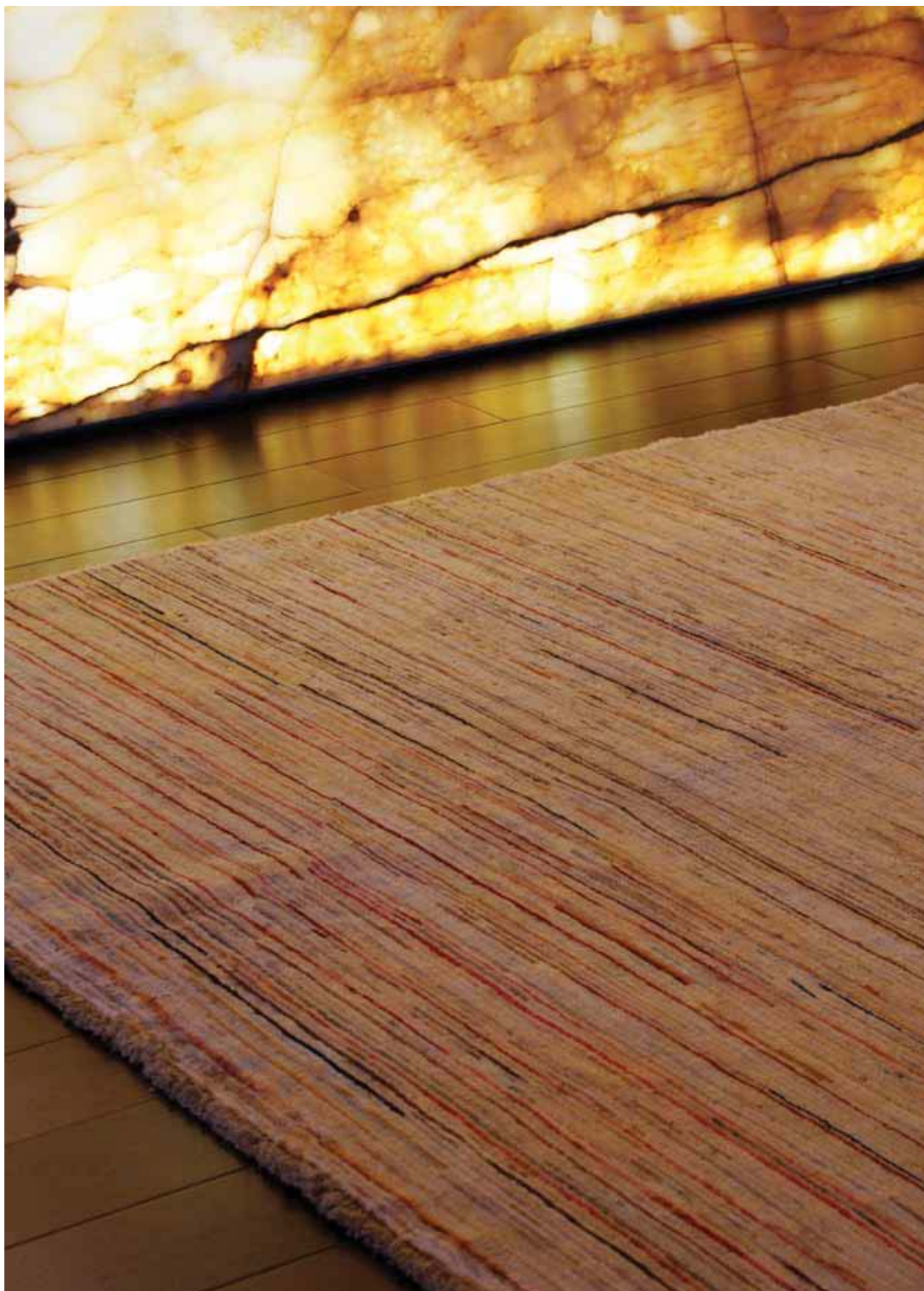
PAK-CHUBI GABEH 239028 100% lã. Produção manual.