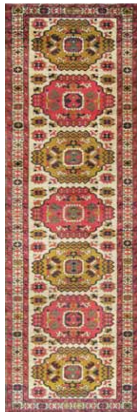
RU-MIKRAH 233243 082x306