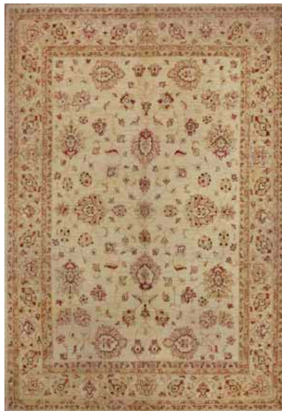
PAK-ZIGLER ISLAMABAD SP/09896 200x296