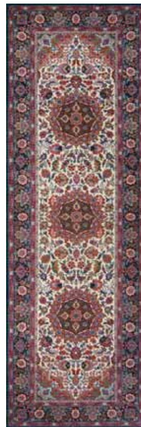
IR-TABRIZJAVAN SP/09305 077x244