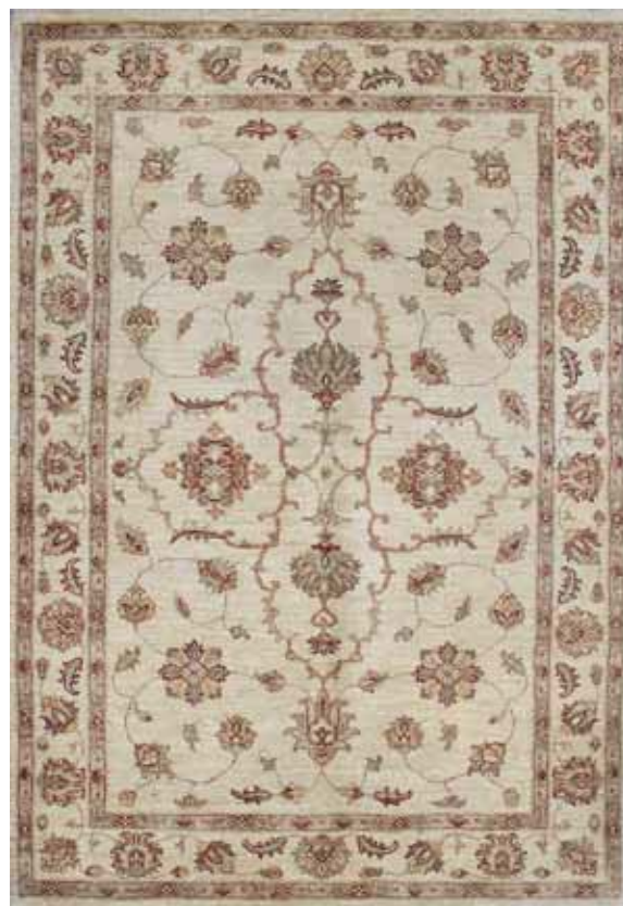
PAK-ZIGLER KARACHI 251888 170x243