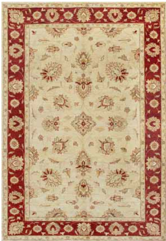
PAK-ZIGLER KARACHI 251213 200x296