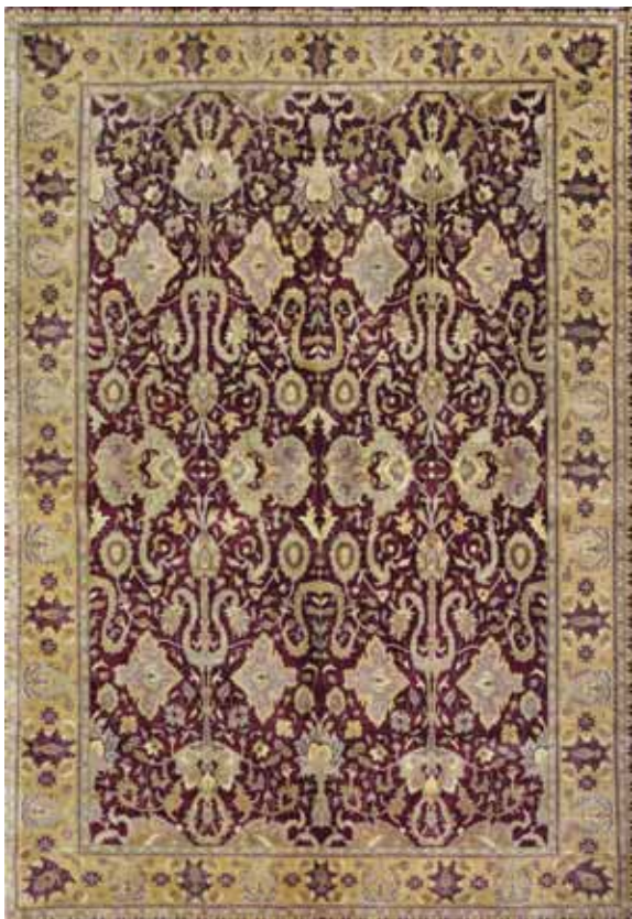
TAJ MAHAL MC1001/006 170x240 / 200x300