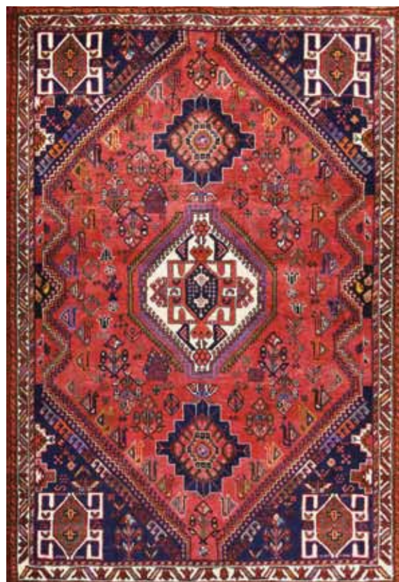
IR-KASHKOLI 250586 127x170