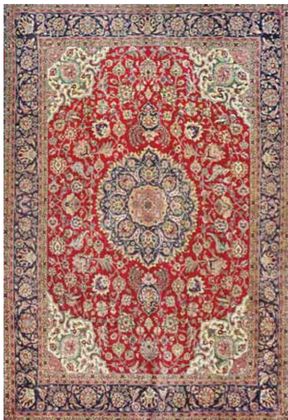
IR-MESCHED 237451 287x388