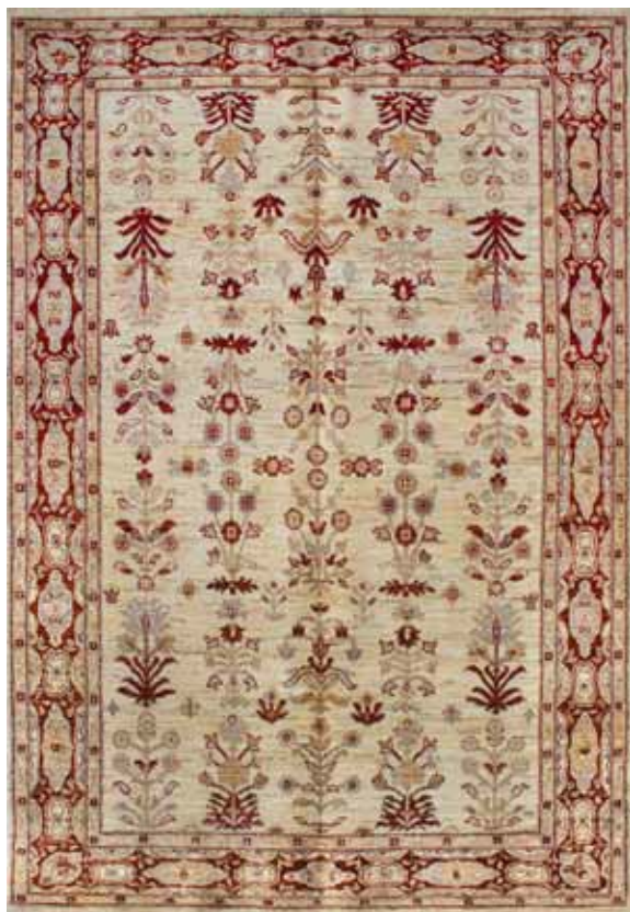
PAK-ZIGLER LAHORE 251025 166x262