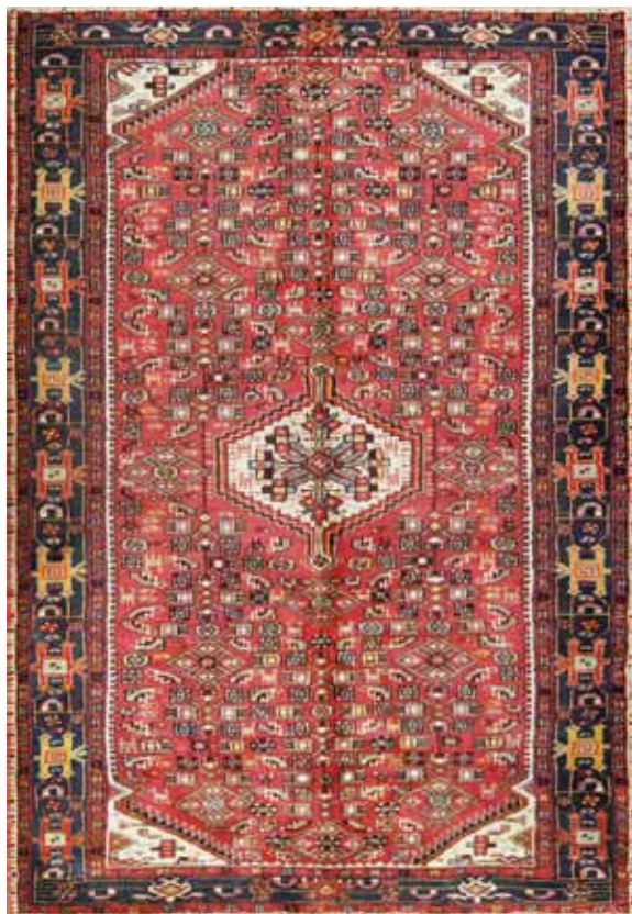
IR-HAMADAN 250527 180x338