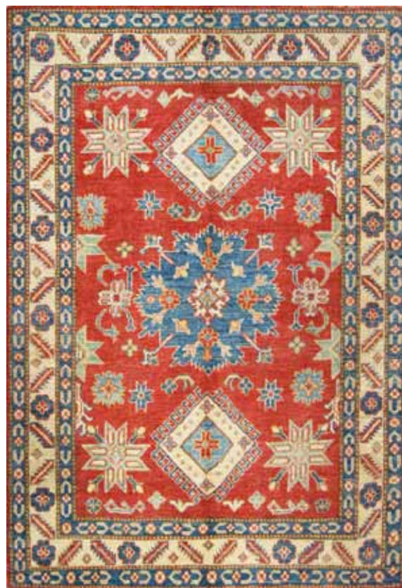
PAK-KAZAK 251096 146x190