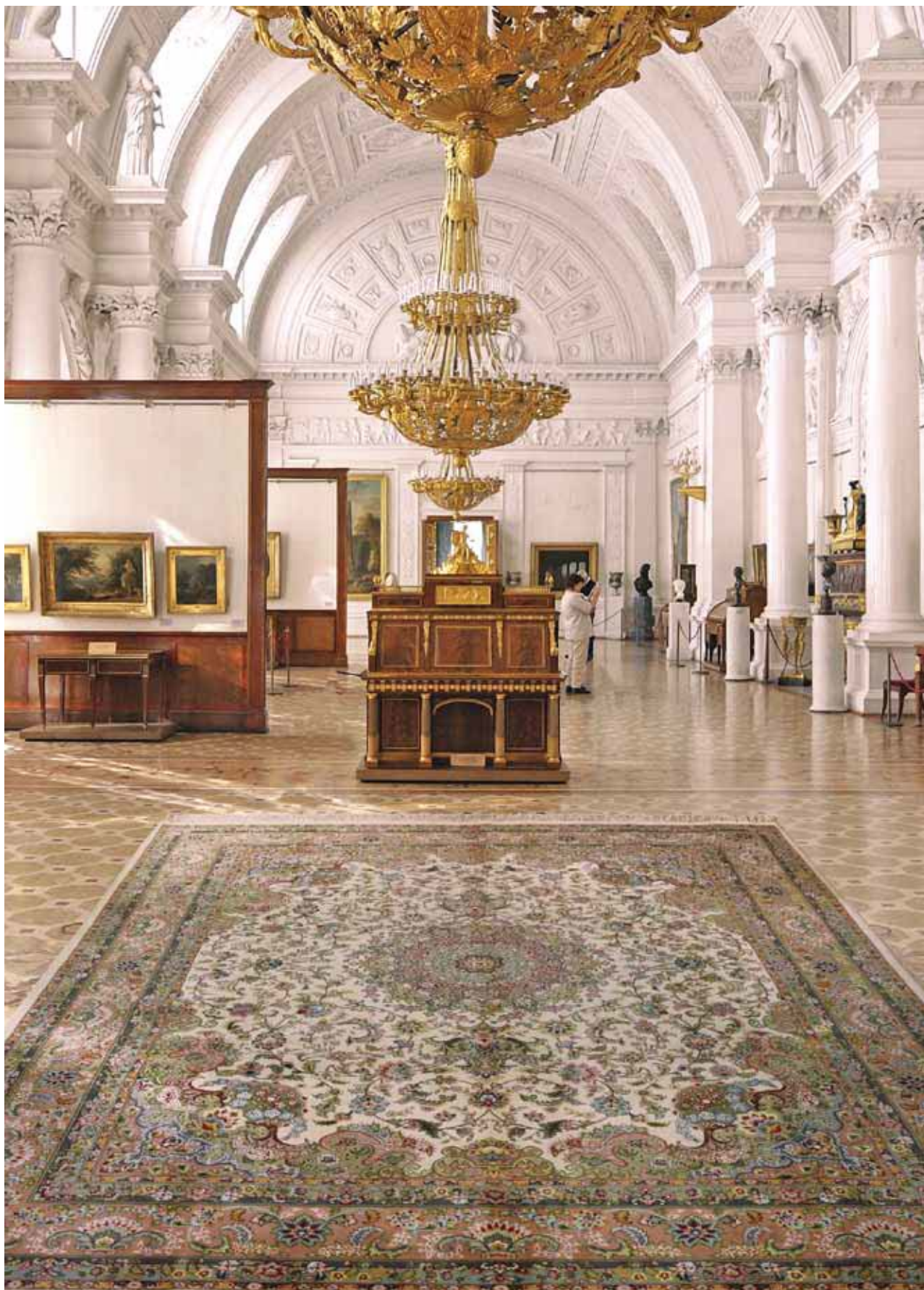
IR-TABRIZ JAVAN SP/09326 100% lã. Produção manual.