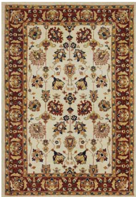
PAK-ZIGLER LAHORE 244844 124x184