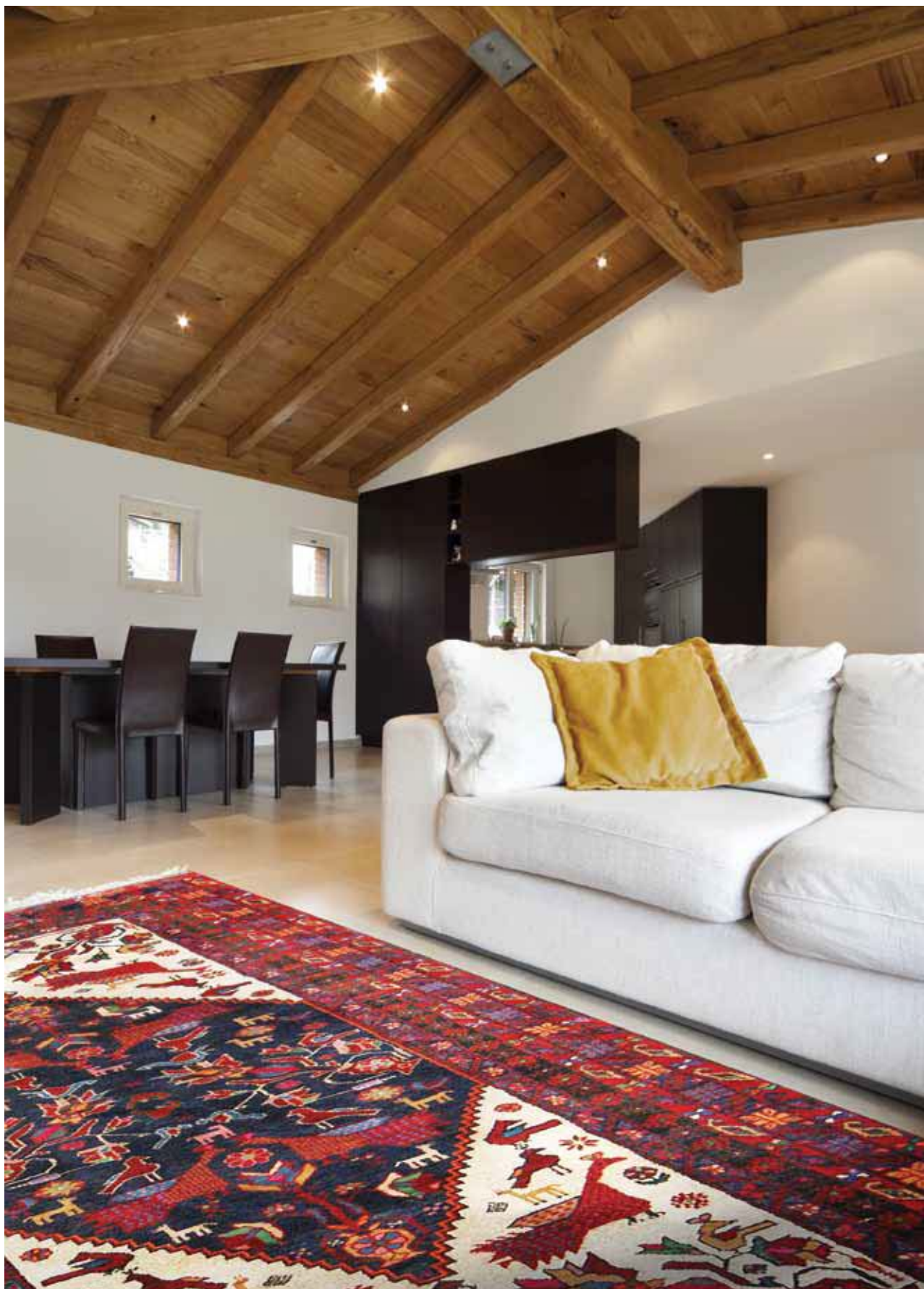
IR-KHORASSAN 250657 100% lã, Produção manual.