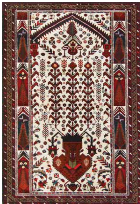
IR-KHORASSAN 250349 107x201