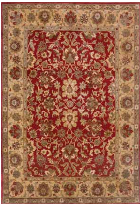
INDO JAIPUR MAS029/006 140x200 / 170x240