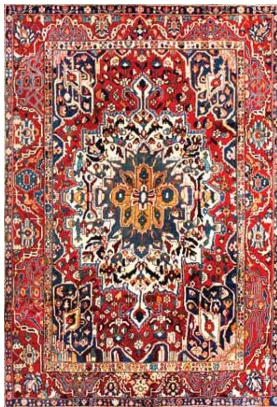
IR-BACTIAR 250449 213x285