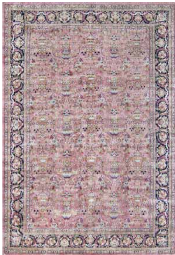
TAJ MAHAL SP/09134 199x294