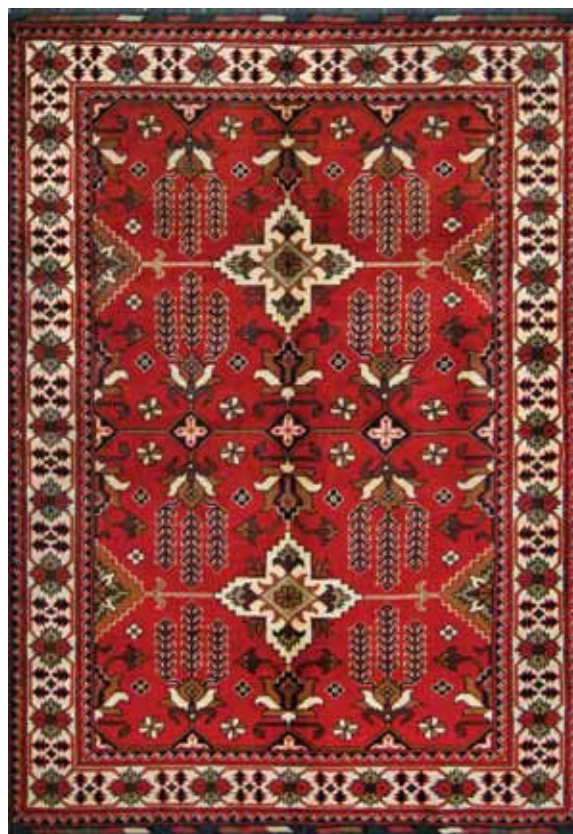
AF-KUNDUZ 249327 152x206