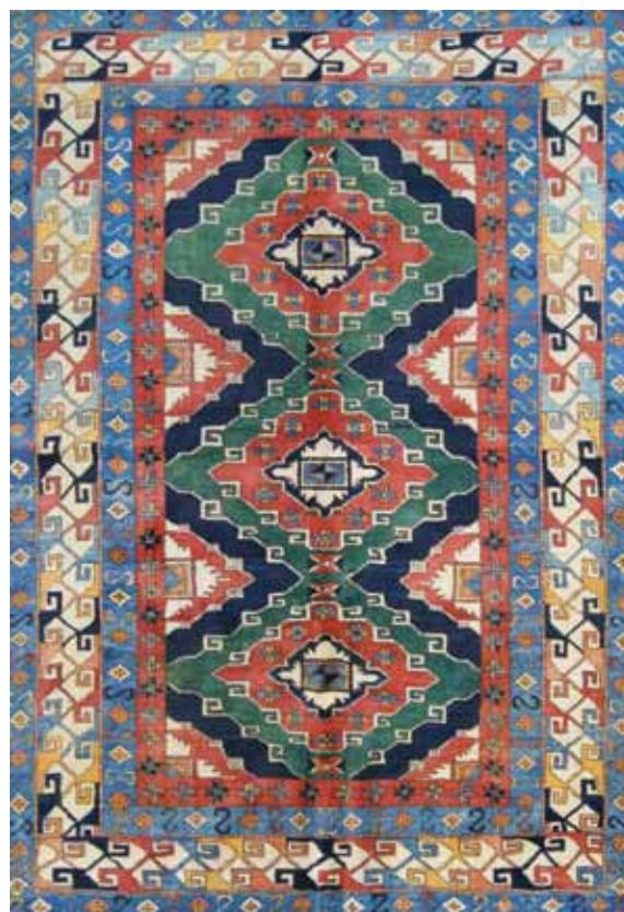
PAK-KAZAK 169115 195x200