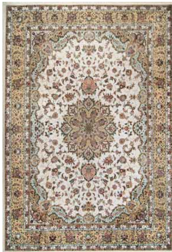
IR-TABRIZ JAVAM SP/09323 274x366