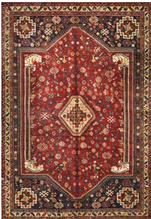
IR-GASHGAY 250298 171x260