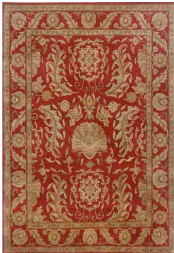
INDO JAIPUR MAS026/006 140x200 / 170x240 / 200x300