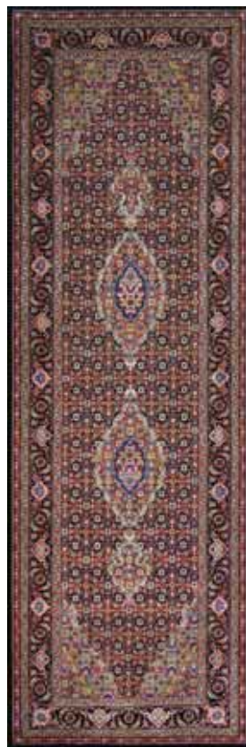
IR-TABRIZ JAVAN SP/09320 080x245