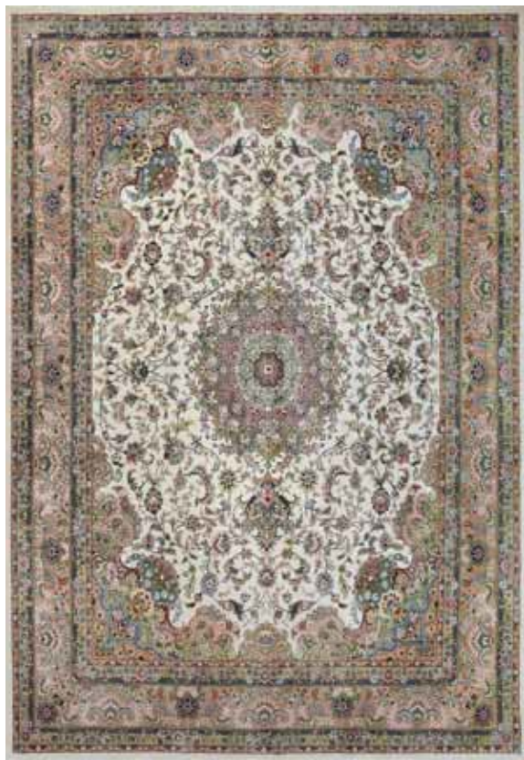
IR-TABRIZ JAVAN SP/09326 244x305