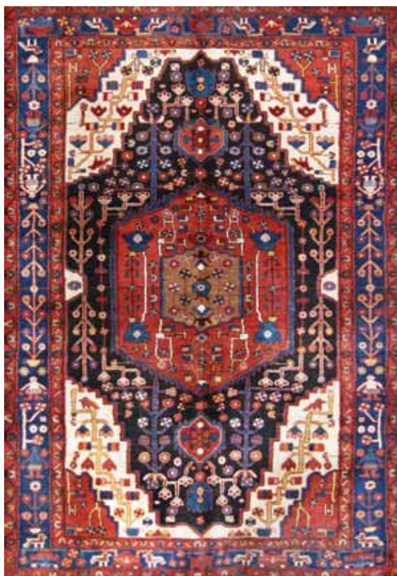
IR-HAMADAN 250526 166x296