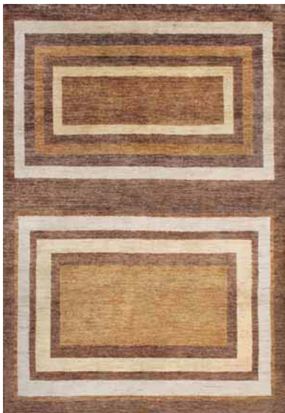
PAK-CHUBI MODERN LD/00921 190x251