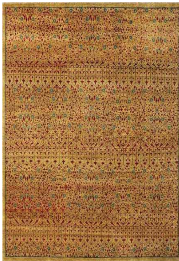
MAMLUK ML23B/115 250x350