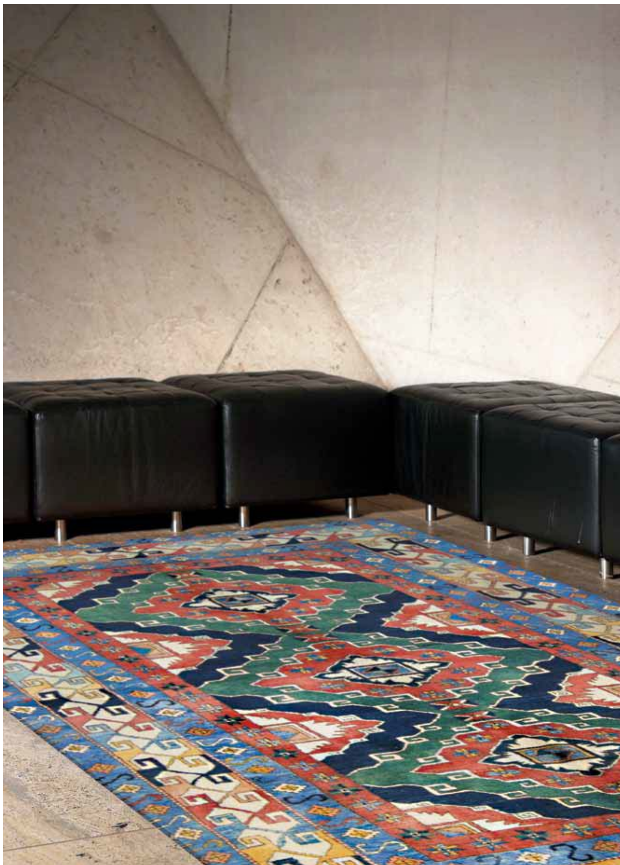
PAK-KAZAK 169115 100% lã. Produção manual.