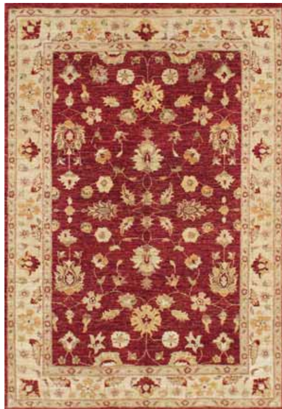
PAK-ZIGLER KARACHI 243226 142x202