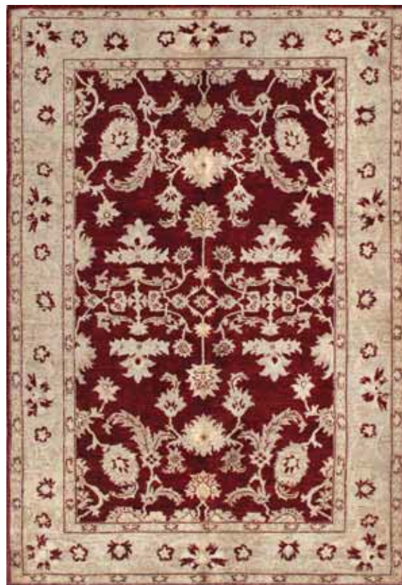
PAK-ZIGLER LAHORE 251024 160x238