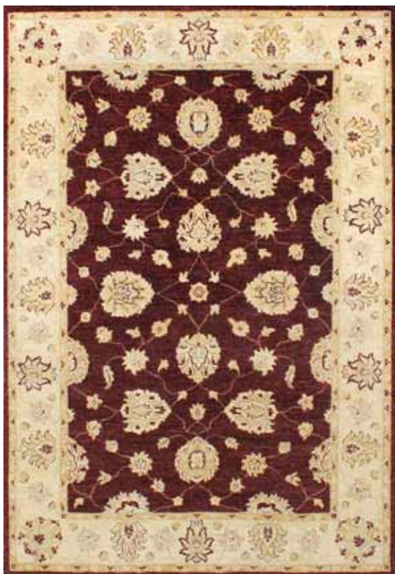
PAK-ZIGLER KARACHI 251592 172x245