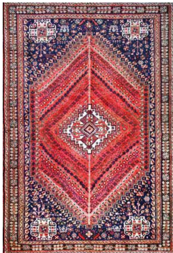
IR-KASHKOLI 250568 188x247