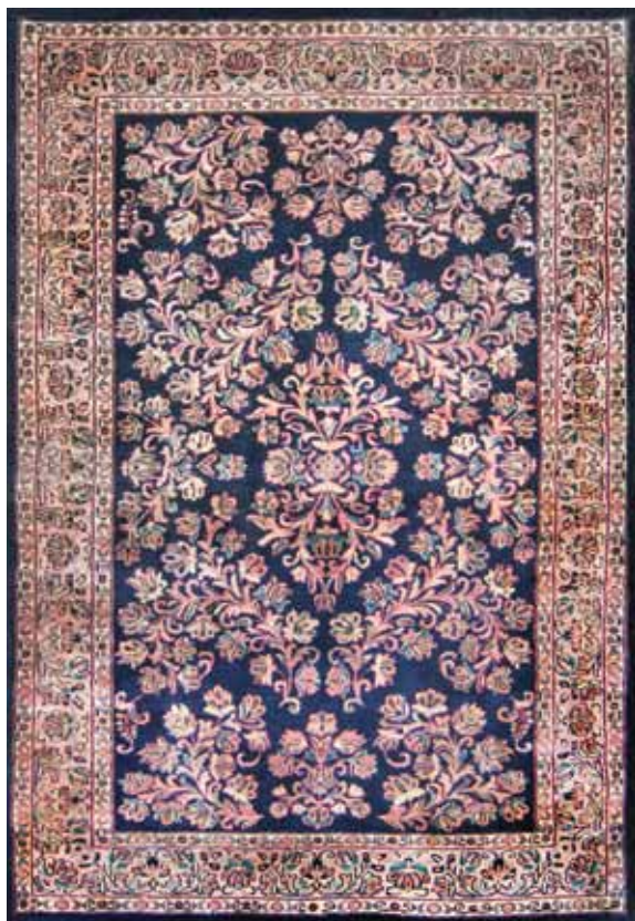
INDO SAROUGH 128304 115x177