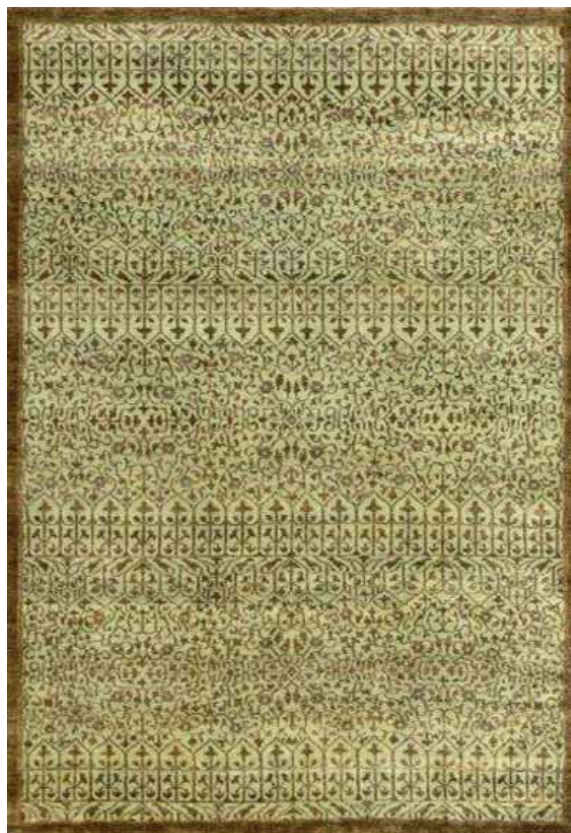
MAMLUK ML23B/004 170x240 / 250x350