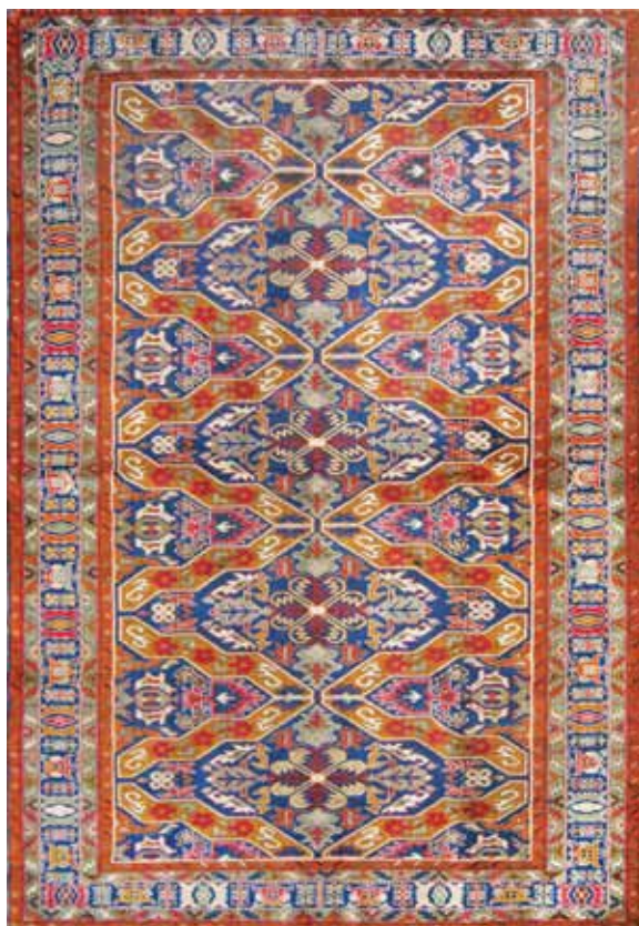
RU-MIKRAH 233268 164x270