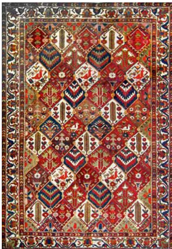
IR-BACTIAR 250494 214x325